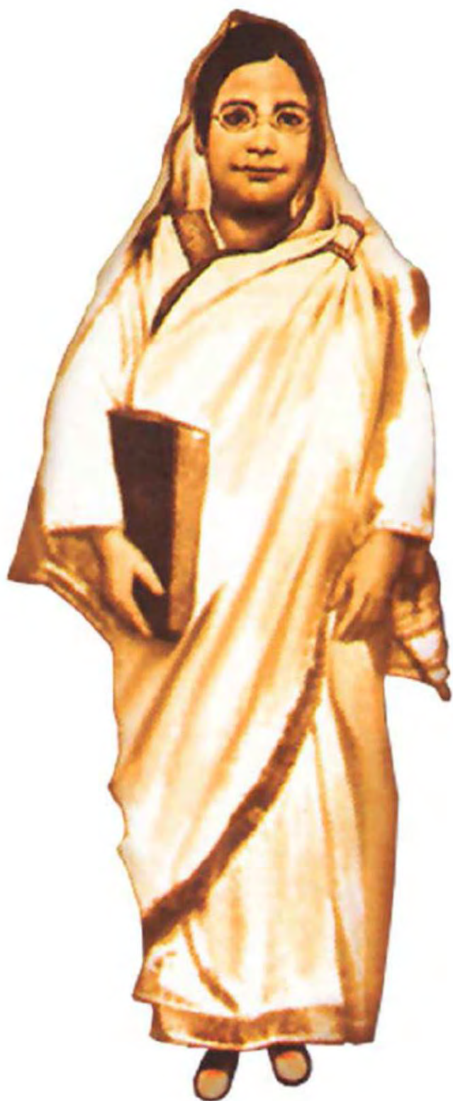
বোগম রোকেয়া সাখাওয়াত হোসেন