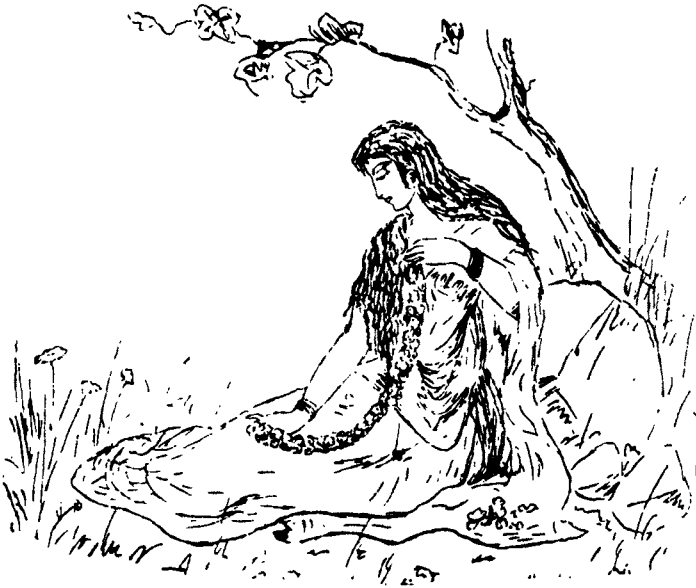
কোমল অঙ্গুলিগুলি রচিতছে মালা। পৃষ্ঠা ২৫৮

‘চিত্রাঙ্গদা’ সচিত্র-সংস্করণের দৃষ্টি রেখাচিত্র অবনীন্দ্রনাথ ঠাকুর - অঙ্কিত