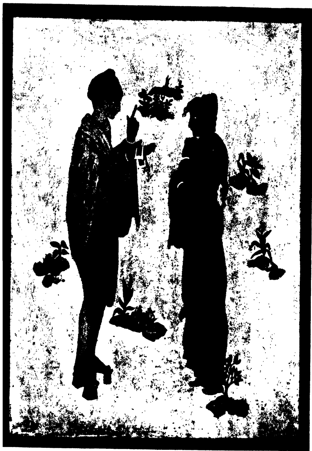
কচ ও দেবযানী অবনীন্দ্রনাথ ঠাকুর - অঙ্কিত